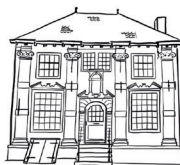
Huis Hoop, J.A. van der Goeskade 69