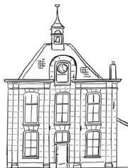
't Soep'uus, Kleine Kade 43