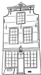
Huis De Baerse, Grote Kade 44